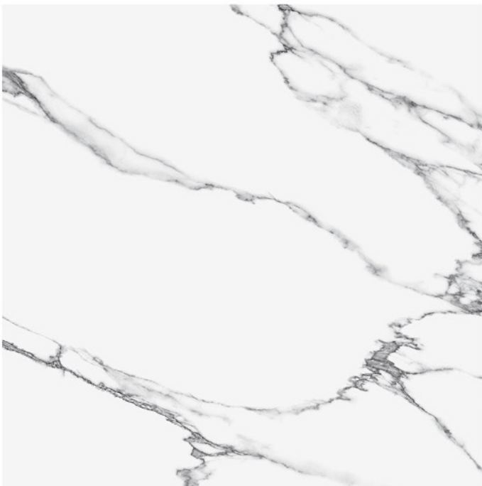
TOKYO WHITE 90X90