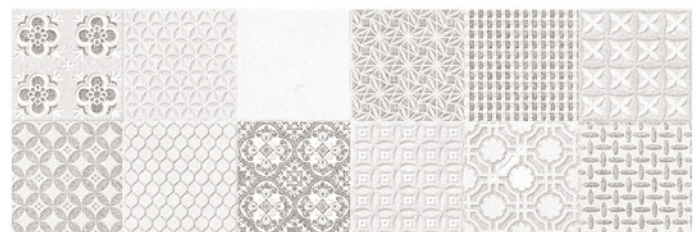
PRAGA DECOR GRIS 30x90