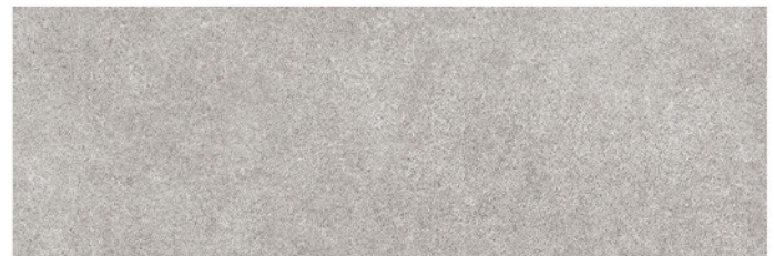
PRAGA GRIS 30x90