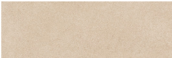
PRAGA BEIGE 30x90