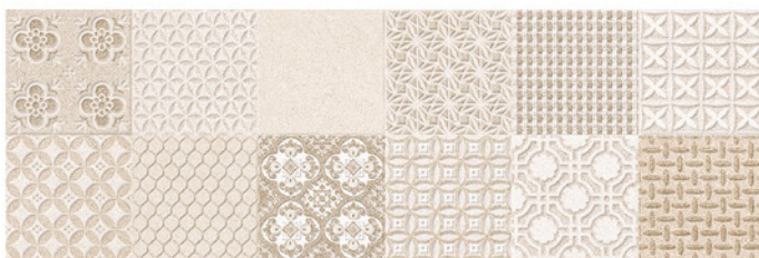
PRAGA DECOR BEIGE 30x90