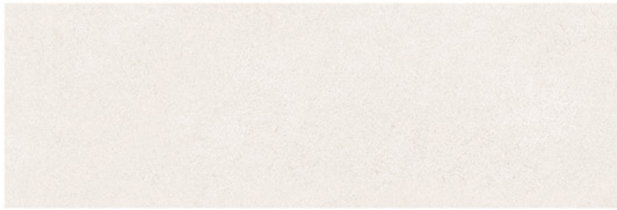
PRAGA CREMA 30x90