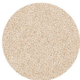
PRAGA BEIGE DETAIL