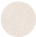
OXFORD BLANCO DETAIL