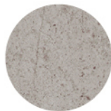
OXFORD PERLA DETAIL