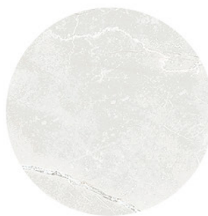
MONTECARLO PERLA DETAIL