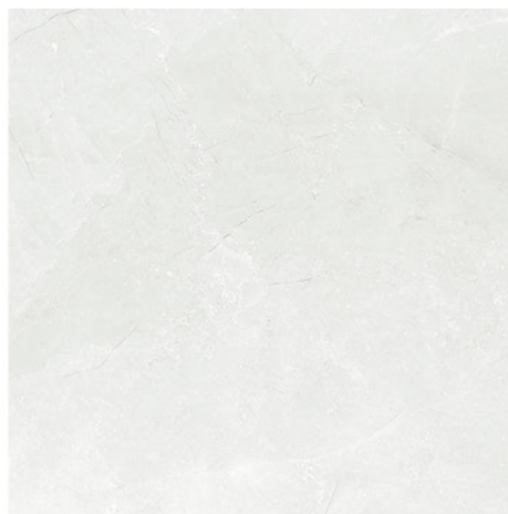
MONTECARLO PERLA 61X61 M9