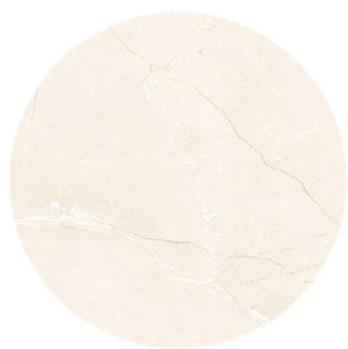
MONTECARLO MARFIL DETAIL