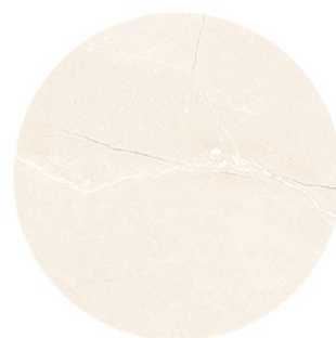
MONTECARLO MARFIL DETAIL