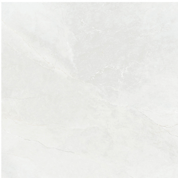
MONTECARLO PERLA 90X90