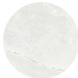
MONTECARLO PERLA DETAIL