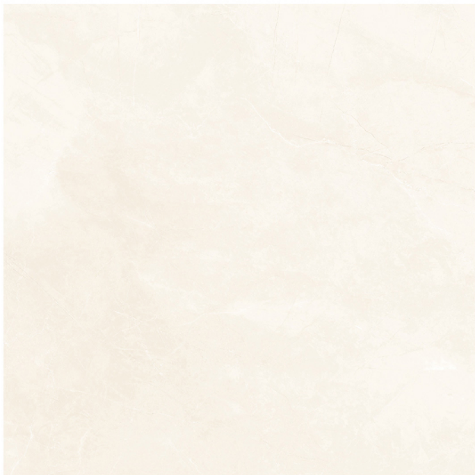
MONTECARLO MARFIL 90X90 16 piezas diferentes / different pieces