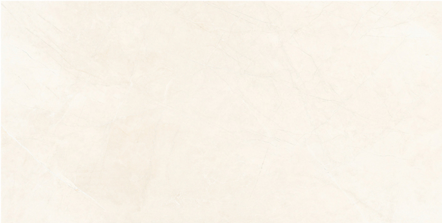
MONTECARLO MARFIL 60X120 16 piezas diferentes / different pieces

60x120 cm / 23,6"x47,2" 90x90 cm / 35,4"x35,4"