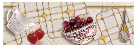
DECOR/2 LUXOR COCINA BEIGE 20x60