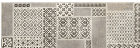
LUXOR DECOR GRIS 20x60