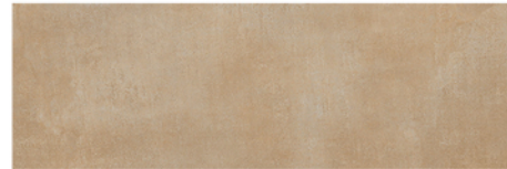
LUXOR BEIGE 20x60