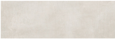
LUXOR PERLA 20x60