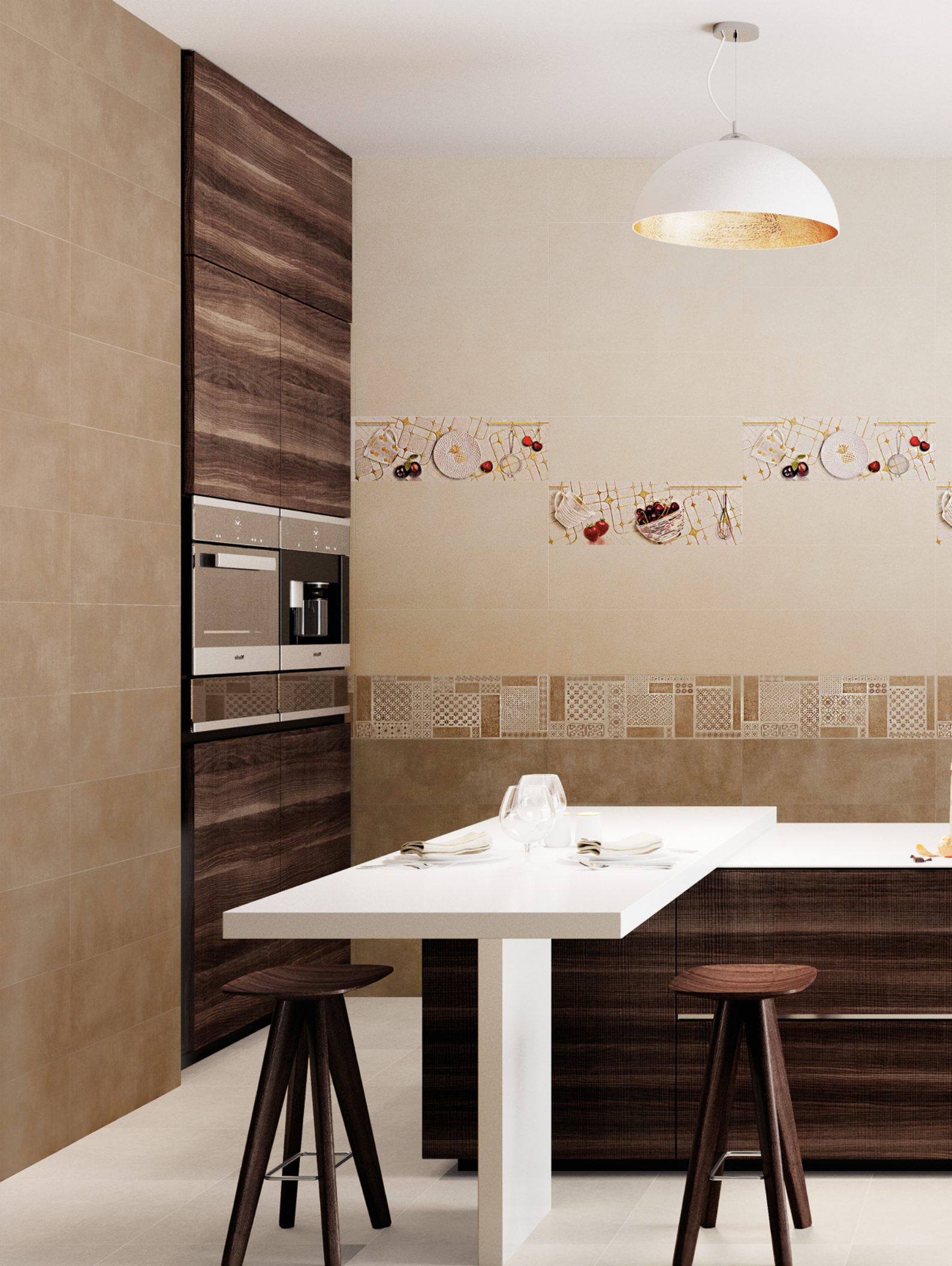
LUXOR CREMA 20x60 LUXOR BEIGE 20x60 LUXOR DECOR BEIGE 20x60 DECOR/2 LUXOR COCINA BEIGE 20x60 CEMENT BLANCO 45x45