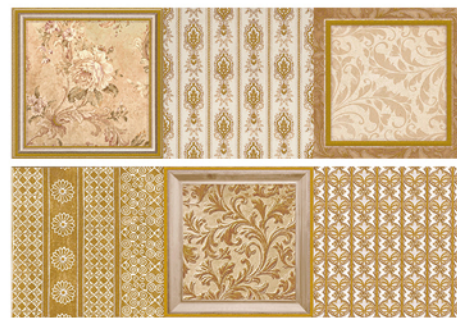
DECOR/2 LUXOR BAÑO BEIGE 20x60