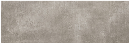
LUXOR GRIS 20x60