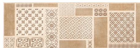
LUXOR DECOR BEIGE 20x60