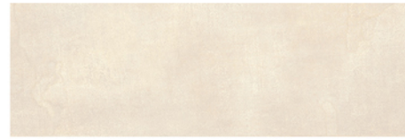
LUXOR CREMA 20x60