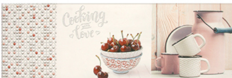
DECOR/2 KRONOS COCINA 20x60