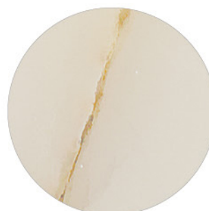
KALA GOLD DETAIL