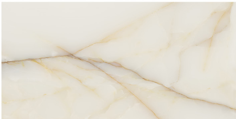
KALA GOLD 60X120