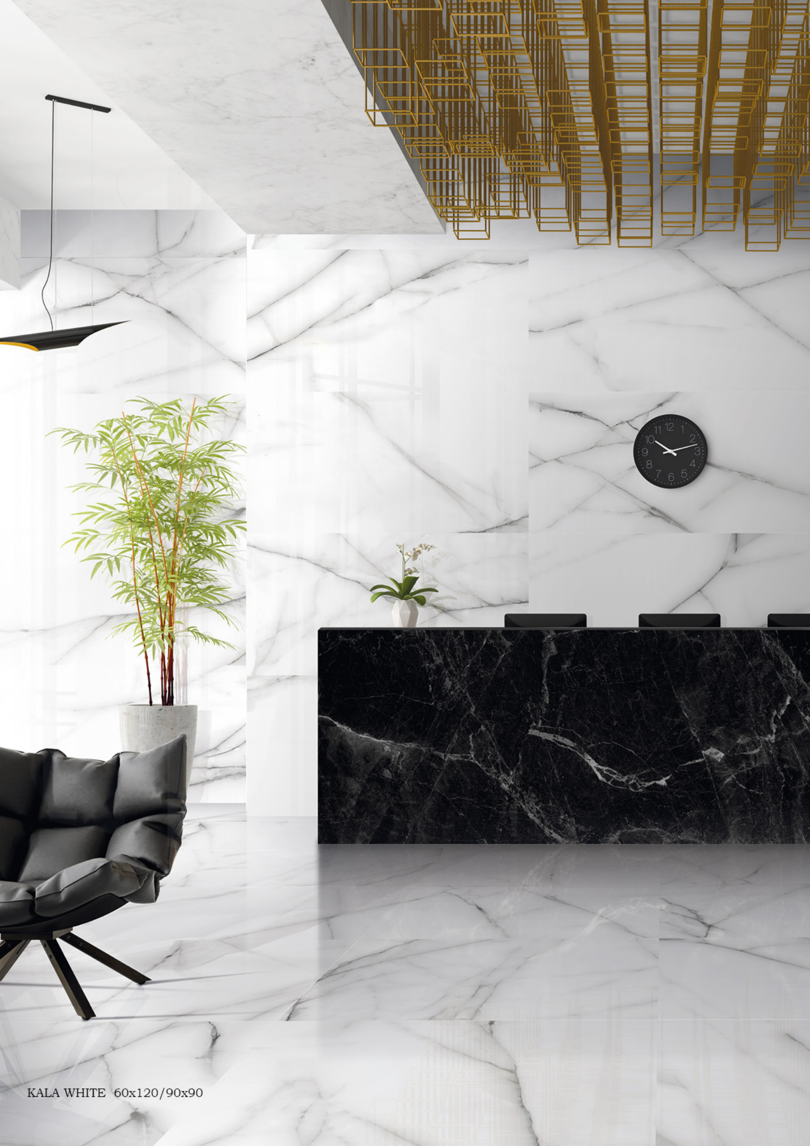
KALA WHITE 60x120/90x90