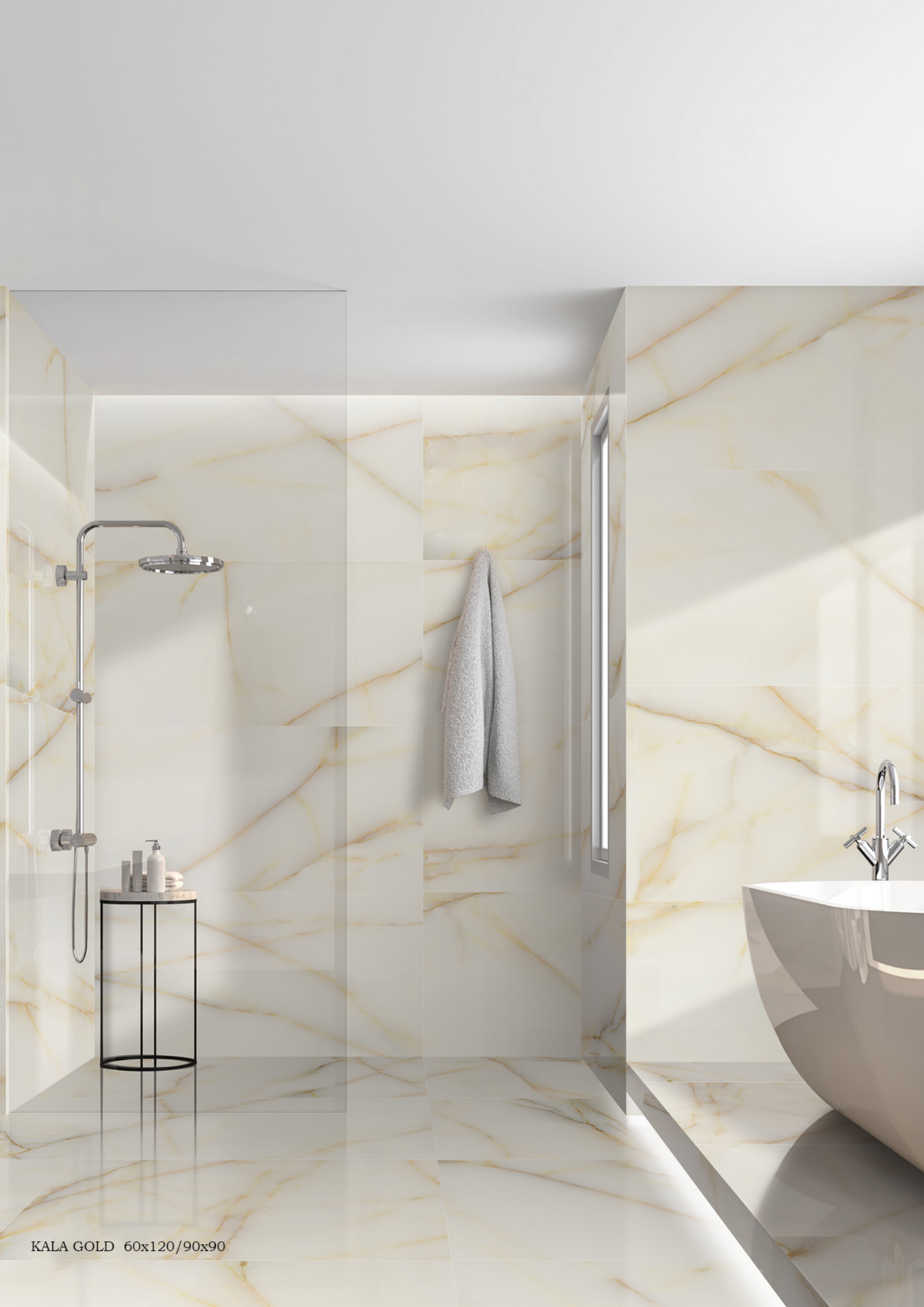
KALA GOLD 60x120/90x90