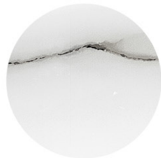
KALA WHITE DETAIL