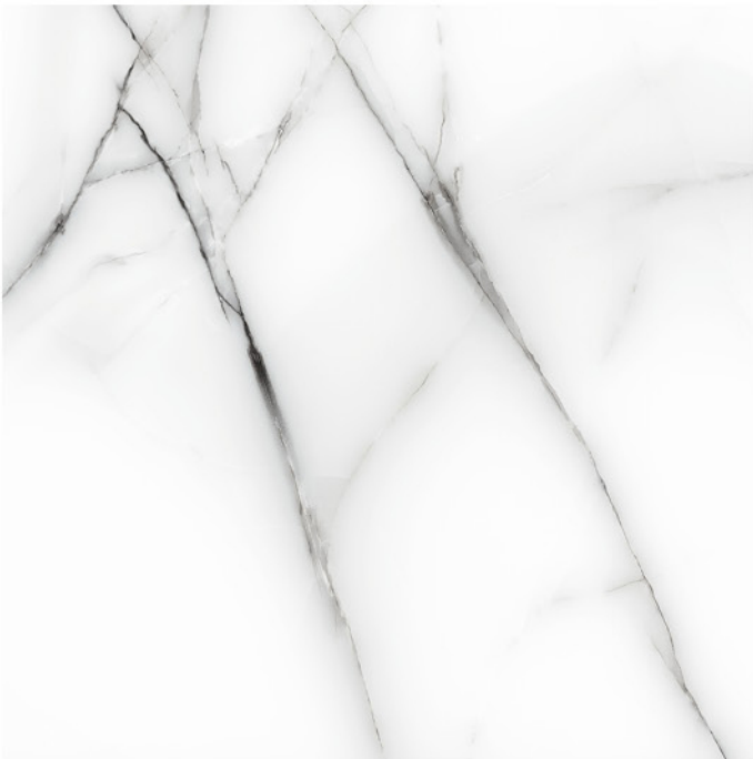
KALA WHITE 90X90