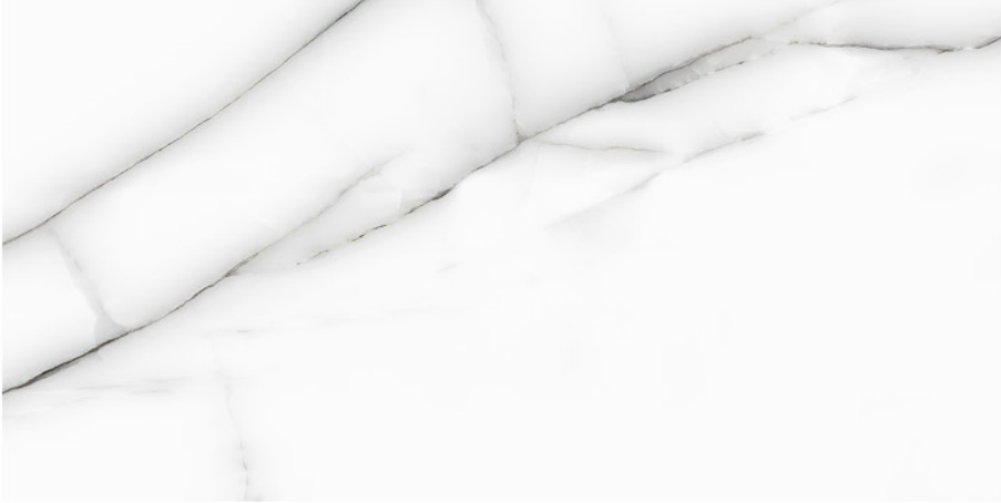
KALA WHITE 60X120

60x120 cm / 23,6"x47,2" 90x90 cm / 35,4"x35,4"