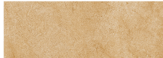
GOBI BEIGE 25x70