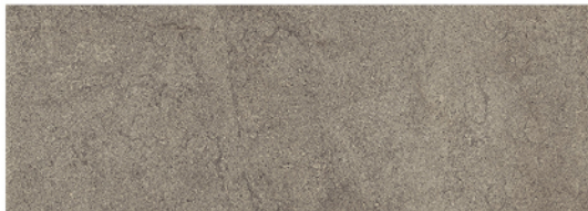
GOBI MARENGO 25x70