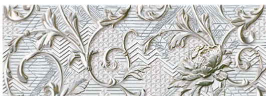
DECOR/2 GOBI BAÑO 25x70