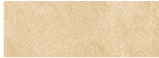
GOBI CREMA 25x70