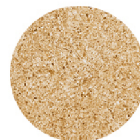
GOBI BEIGE DETAIL