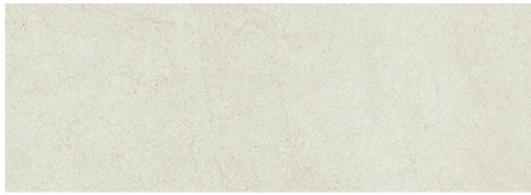
GOBI GRIS 25x70