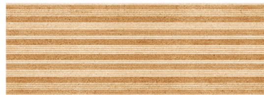
GOBI RELIEVE BEIGE 25x70