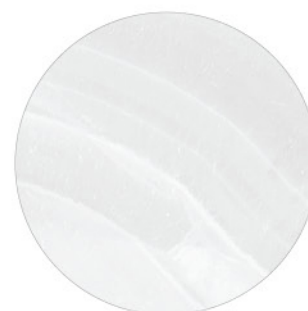
GANTE PERLA DETAIL