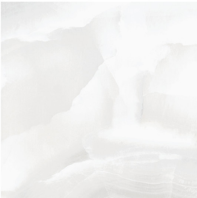
GANTE BLANCO 90X90