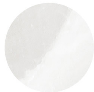
GANTE BLANCO DETAIL