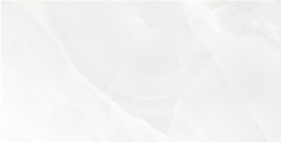
GANTE BLANCO 60X120