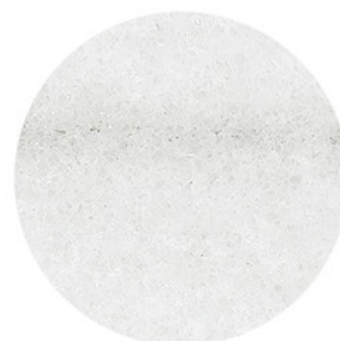
FRESH BLANCO DETAIL