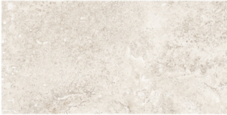
FONTANA IVORY LUX 30x60 M22 20 piezas diferentes / different pieces