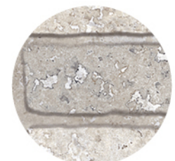
FONTANA DECOR PEARL LUX DETAIL