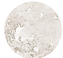
FONTANA PEARL LUX DETAIL