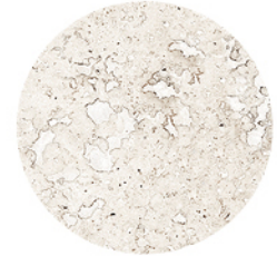
FONTANA IVORY LUX DETAIL