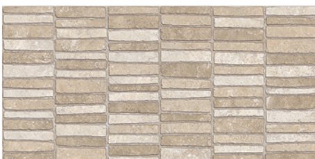
FONTANA DECOR BEIGE LUX 30x60 M17 4 piezas diferentes / different pieces