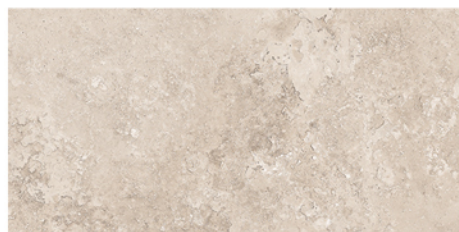
FONTANA BEIGE LUX 30x60 M22