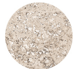
FONTANA BEIGE LUX DETAIL