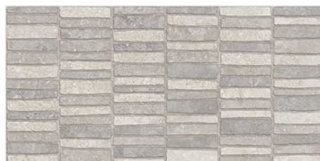
FONTANA DECOR PEARL LUX 30x60 M17