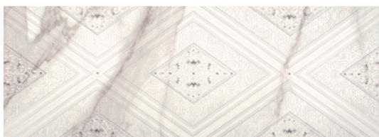
DECOR CALACATTA MATE CLASSIC 25x70