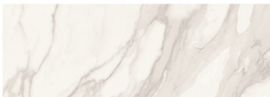
CALACATTA MATE 25x70