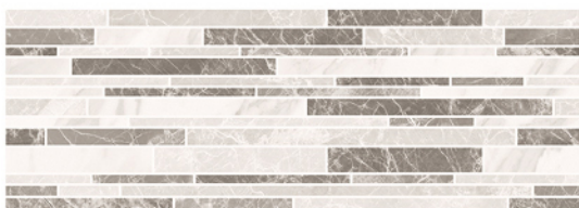
LONDON MIX 25x70