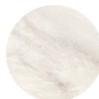
CALACATTA MATE DETAIL