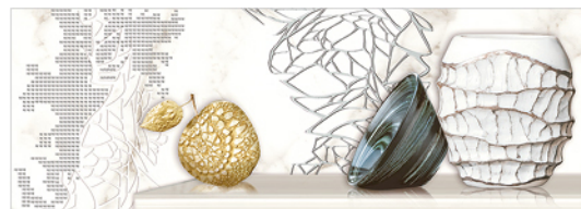
DECOR/2 CALACATTA MATE COCINA 25x70