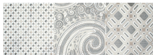
DECOR/2 CALACATTA MATE BAÑO 25x70