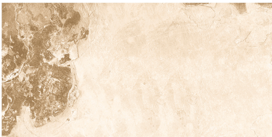
BULNES BEIGE 60X120