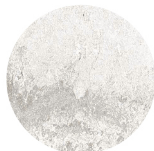
BULNES BLANCO DETAIL