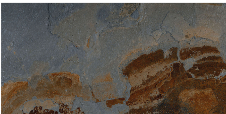
BULNES ÓXIDO AZUL 60X120