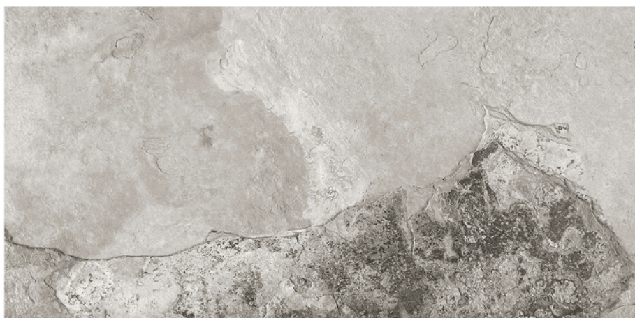
BULNES GRIS 60X120