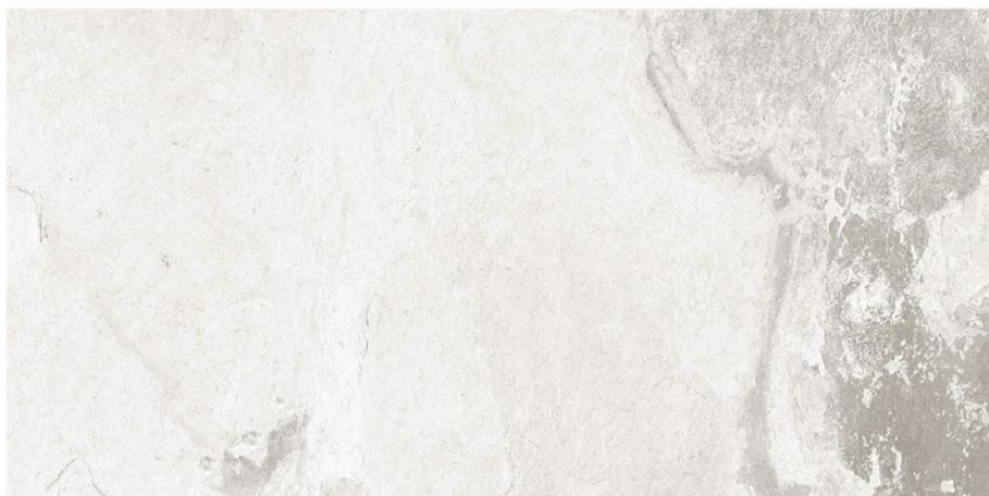
BULNES BLANCO 60X120