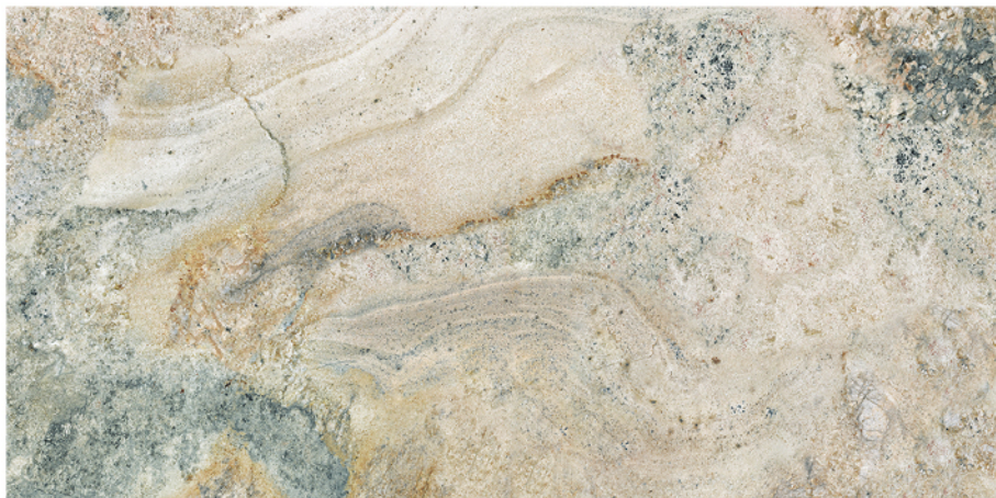
BULNES CREMA 60X120