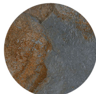
BULNES ÓXIDO AZUL DETAIL