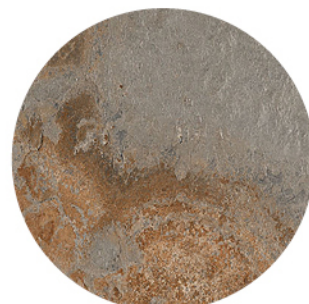
BULNES ÓXIDO GRIS DETAIL