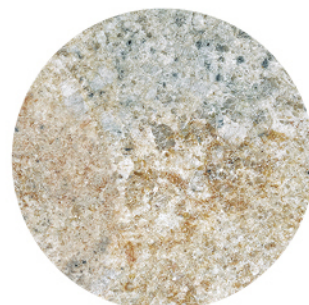
BULNES CREMA DETAIL