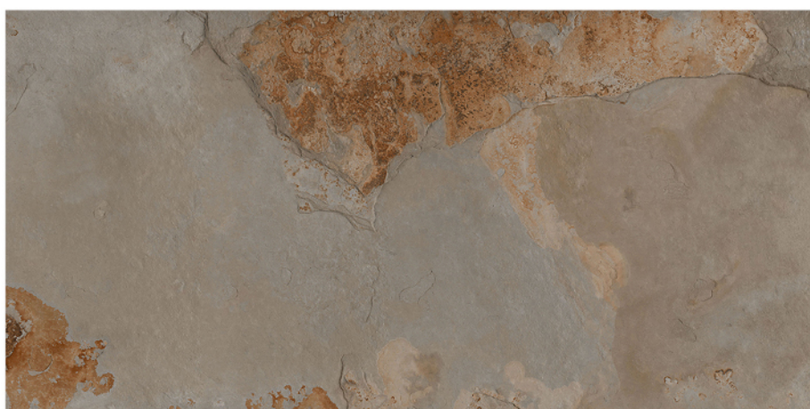
BULNES ÓXIDO GRIS 60X120