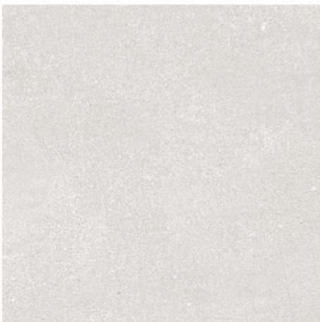
BUDAPEST PERLA 60x60 M36 8 piezas diferentes / different pieces