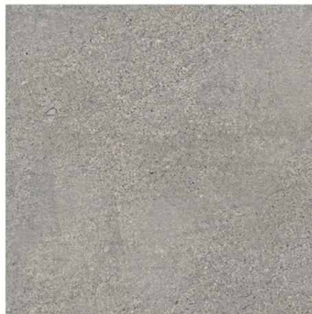
BUDAPEST GRIS 60x60 M36