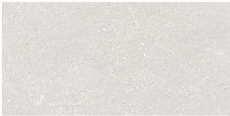
BUDAPEST PERLA 30x60 M22 16 piezas diferentes / different pieces

60x60 cm / 23,6"x23,6" 30x60 cm / 11,8"x23,6"