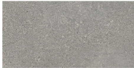
BUDAPEST GRIS 30x60 M22