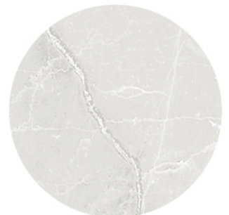
BRESCIA PERLA DETAIL