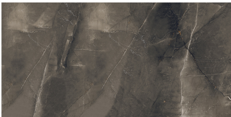
BRESCIA MARRÓN S-PULIDO 60X120