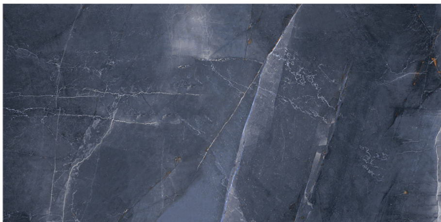
BRESCIA AZUL S-PULIDO 60X120