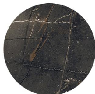
BRESCIA MARRON DETAIL