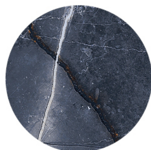
BRESCIA AZUL DETAIL