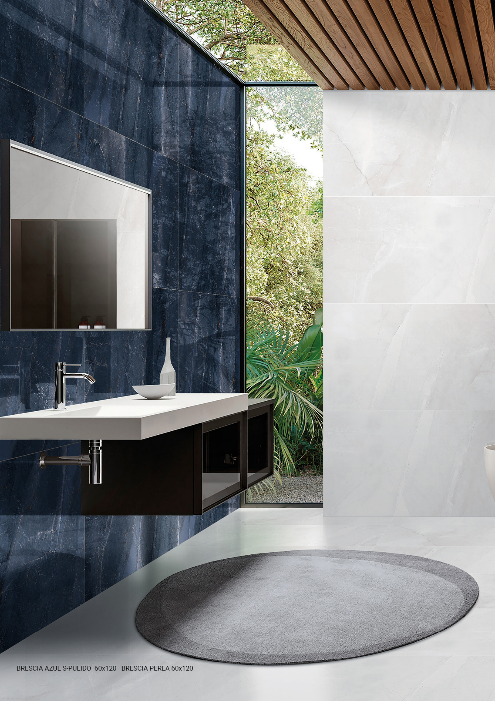
BRESCIA AZUL S-PULIDO 60x120 BRESCIA PERLA 60x120