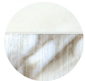
BORG DECOR NATURAL LUX DETAIL