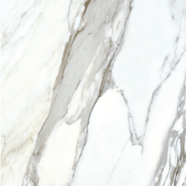
BORG0 NATURAL LUX 80x80 19 piezas diferentes / different pieces