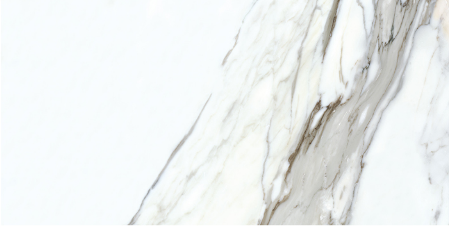
BORG0 NATURAL LUX 60X120 19 piezas diferentes / different pieces