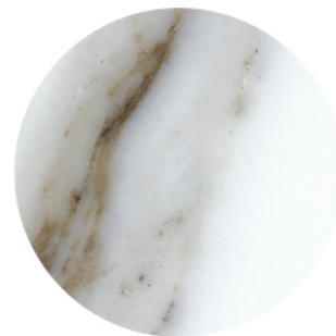
BORG0 NATURAL LUX DETAIL