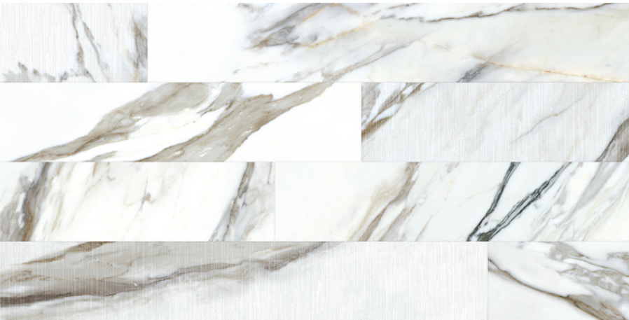
BORG DECOR NATURAL LUX 60X120 4 piezas diferentes / different pieces