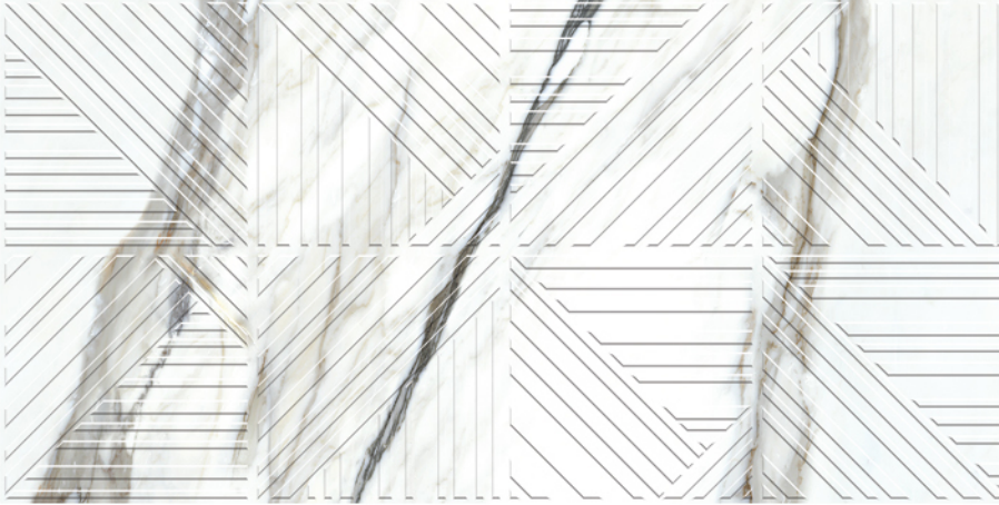
BORG STRIPES-R NATURAL LUX 60X120 19 piezas diferentes / different pieces