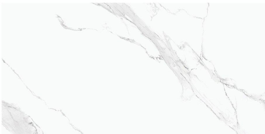
BOLONIA BLANCO 60X120 8 piezas diferentes / different pieces