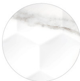
ARTIC DECOR WHITE DETAIL