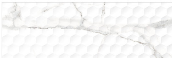
ARTIC DECOR WHITE 30x90