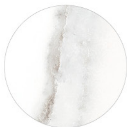
ARTIC WHITE DETAIL