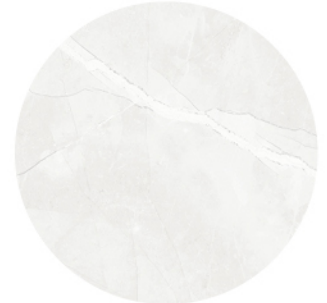
ANSÓ BLANCO LUX DETAIL