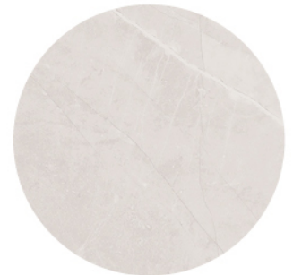
ANSÓ GREIGE LUX DETAIL