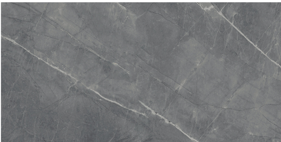
ANSÓ GRIS LUX 60X120