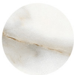
ALASKA GOLD DETAIL