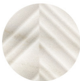
ALASKA DECOR GOLD DETAIL