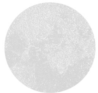
AÍNSA PERLA LUX DETAIL