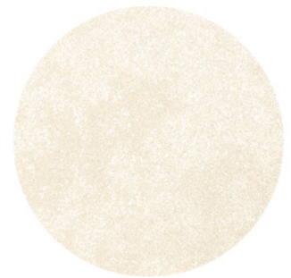
AÍNSA CREMA LUX DETAIL