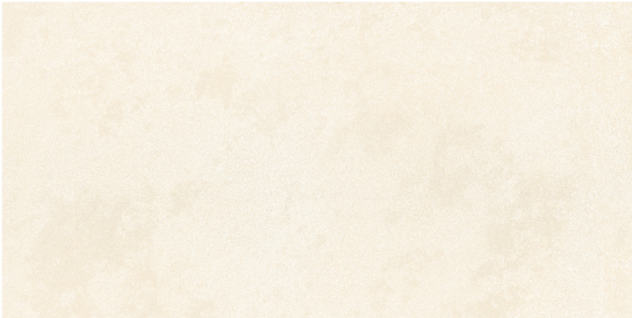
AÍNSA CREMA LUX 60X120 8 piezas diferentes / different pieces